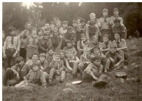
Obr. 14: Výprava na Veselský chlum, 1971.

Určitý čas jsme se setkávali s nepříjemnou reakcí kluků tankistů. Ale když poznali, že jsme hoši normální, zeptali se znovu: „Tak doopravdy, co jako jste?“ Jeden vtipálek od nás tomu dal korunu: „Vojenský pohřební ústav“. Potom jsme konečně museli kápnout božskou.