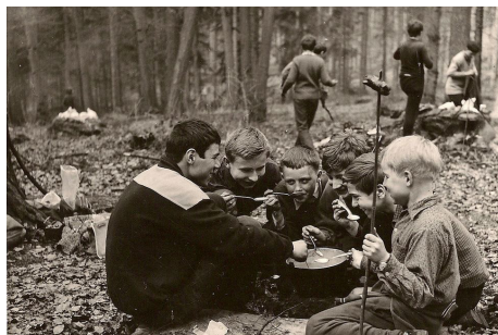
Obr. 11: Společné družinové jídlo.

Překvapilo nás, jak děti správně domýšlely to, k čemu jsme se ještě nedostali.