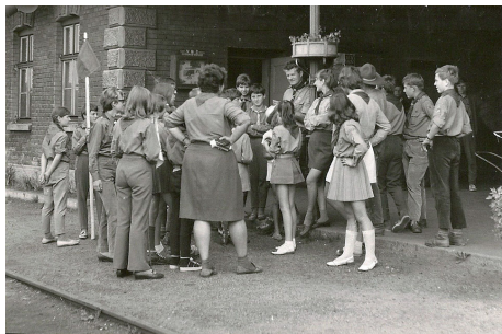
Obr. 6: Na nádraží v Horní Cerekvi při cestě na Tábor u Volačvího rybníka.

Velmi nesnadné podmínky byly v době komunistické totality, kdy jsme se snažili neztratit před dětmi tvář a pracovat tak, abychom se nezpronevěřili zásadám, ze kterých jsme v Sokole, YMCE (Young Men's Christian Association je křesťanské sdružení mladých mužů, nejstarší a největší celosvětovou mládežnickou organizací na světě) a skautu vzešli.