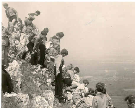
Obr. 8: Výprava na Pálavu, 1971.

Maminka měla na krku mě a bratra, a tak zůstala naprosto bez prostředků, ale nezhavovali jsme díky obětavým a statečným lidem, kteří se nebáli nám všemožným způsobem pomáhat, ať už finančně, potravinami nebo morálně. A tak jsem mohl navštěvovat gymnázium a hudební školu a sportovat. Třeba lyžařské vázání se spodním tahem mi věnovali moji vedoucí ze sokola.