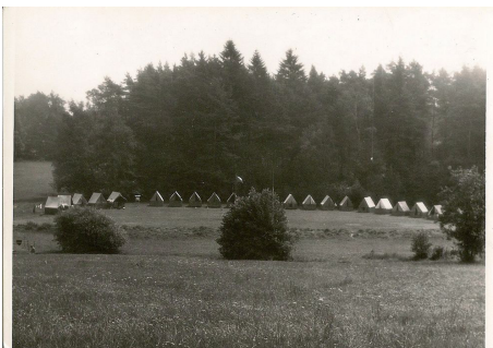
Obr. 4: Druhý tábor u „Volavčího rybníka“, 1970.

V roce 1970 se komunisté „vzpamatovali“ a skauting v naší republice zlikvidovali. Celkem v naší historii byl skauting zlikvidován třikrát. Poprvé provedli likvidaci nacisté v roce 1940. Podruhé komunisté v roce 1950. Potřetí opět komunisté v roce 1970.