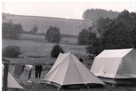
Obr. 5: Tábor v roce 1969.