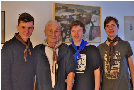
Obr. 17: Na návštěvě u Kamzika, Moravské Knínice, leden 2017.

Od ohně se ozvalo jedno vlče: „Kopněte to do sebe.“ A bylo po rozpacích.